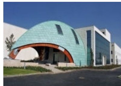
Attuale Sede Aziendale

Grazie alla esperienza maturata con in più grandi gruppi industriali del settore a livello mondiale Manfredini & Schianchi è diventata il punto di riferimento assoluto per chi ambisce ad ottenere il massimo rendimento produttivo e qualitativo dalle proprie linee di produzione nel pieno rispetto ambientale, con costi di gestione limitati e consumi energetici molto contenuti mettendosi così in grado di competere nel panorama dell'economia globalizzata.